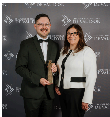
Quality Inn & Suites Val-d'Or