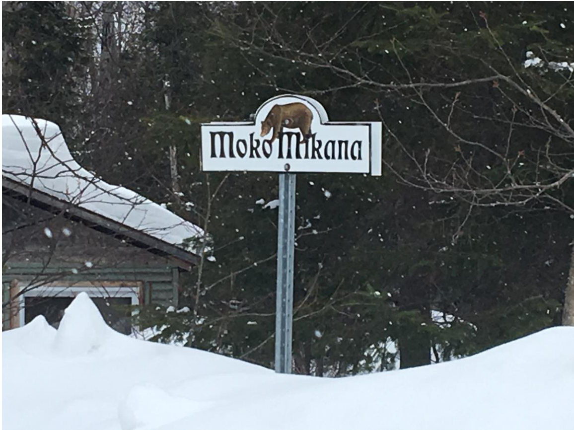
Le panneau signalétique « Moko Mikana », en algonquin, qui signifie « chemin de l'ours » en français.